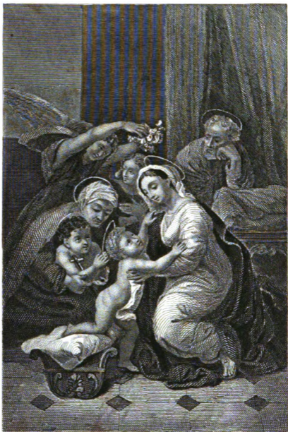
LA SAINTE FAMILLE .