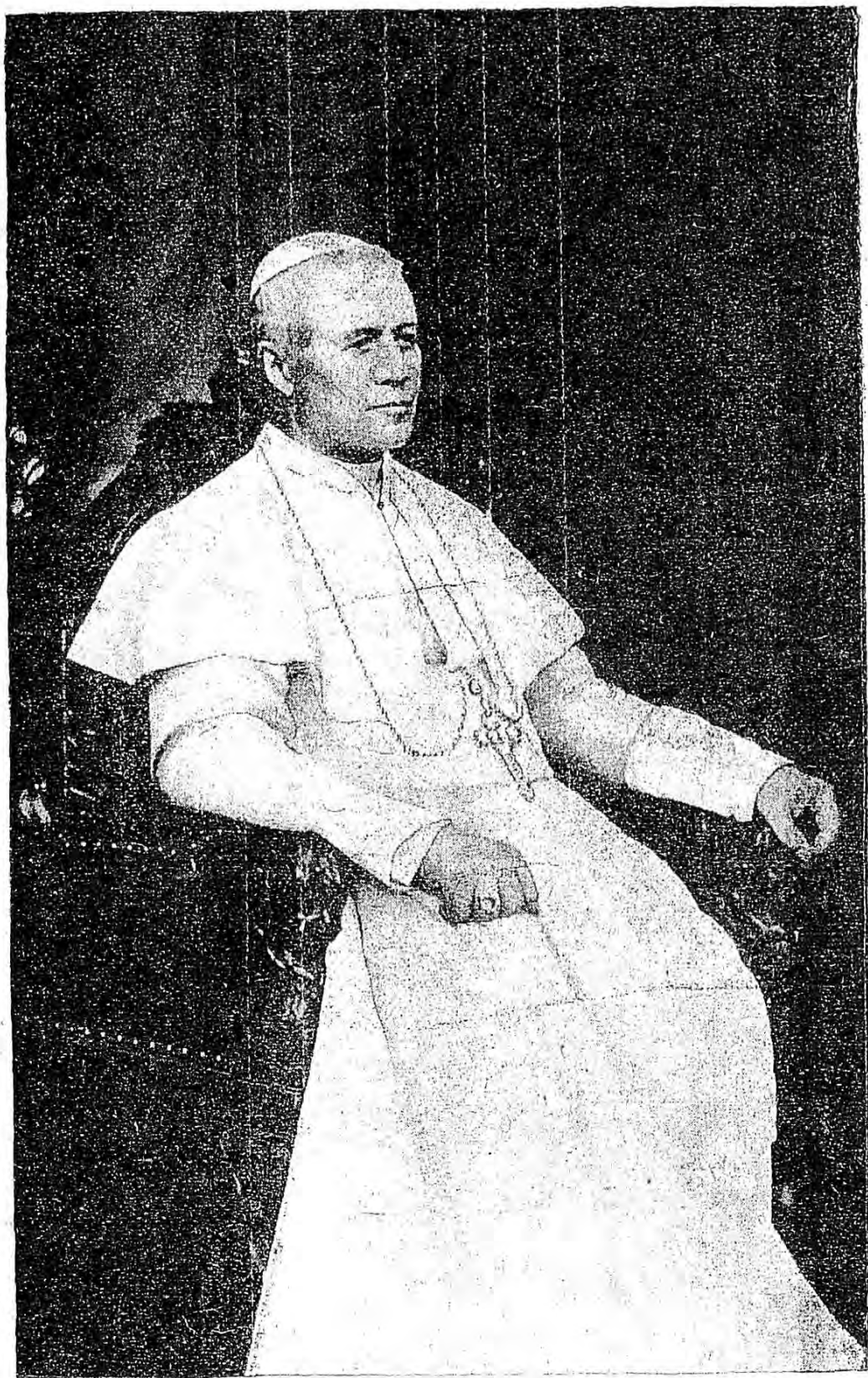
SA SAINTETÉ PIE X