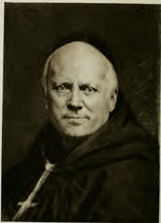
DOM GUÉRANGER, 1875