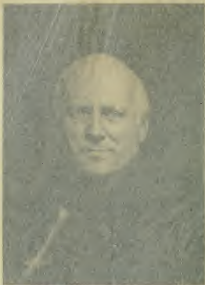
100 W. GEORGE STREET, 1870