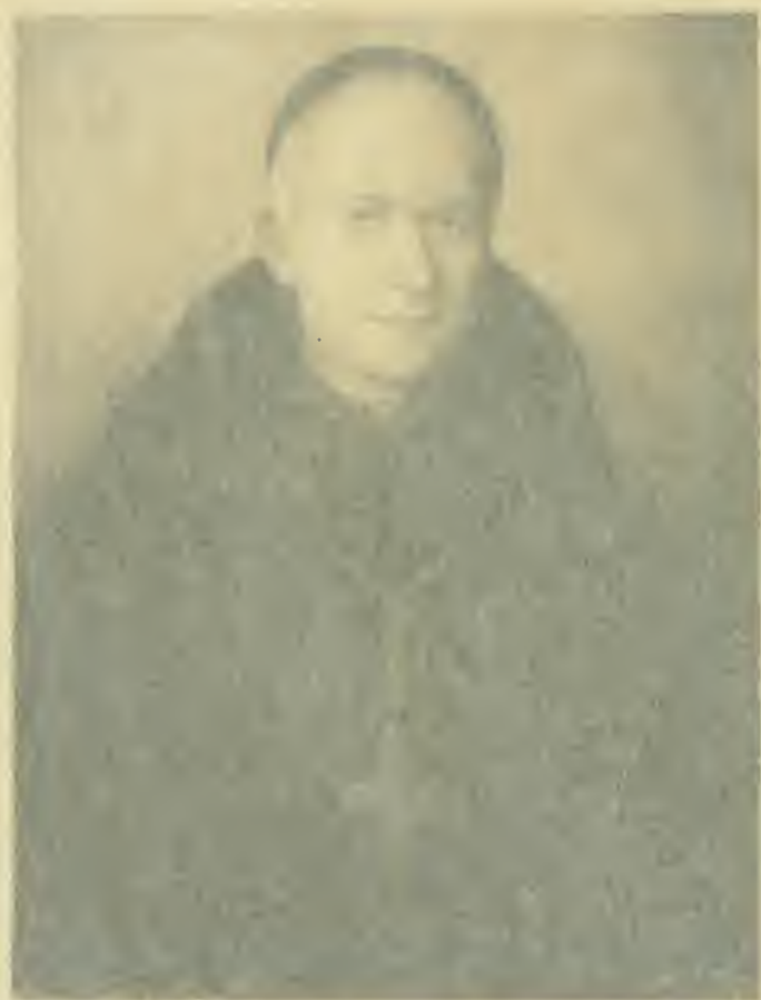
THE HONORABLE CHANG AND CHUNG