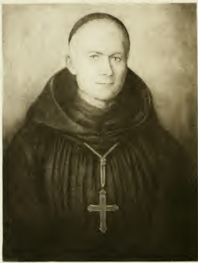
DOM GUÉRANGER 1842