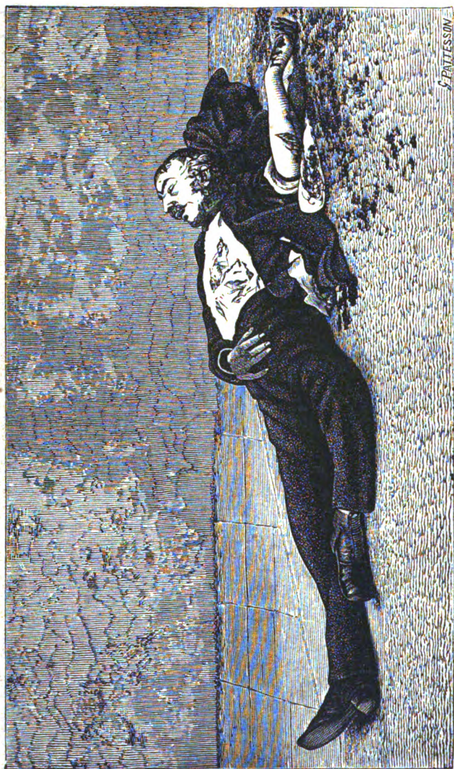
La Victime des Francs-maçons.