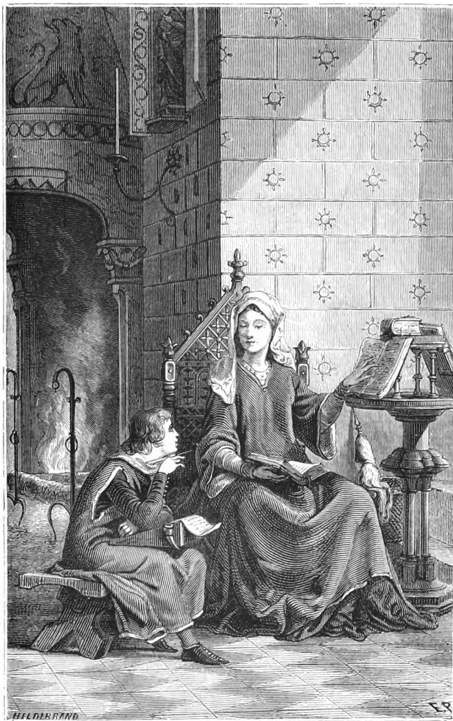
Godefroi fut instruit par sa mère, sainte Ide.