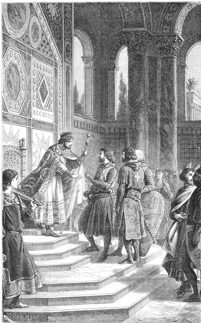
Godefroi et les barons reçus par l'empereur Alexis.