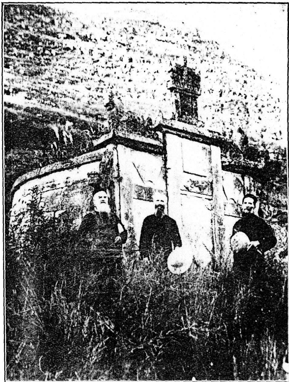
LE TOMBEAU DU PERE AUBRY à Hin-Y-Fou (1882)