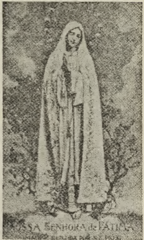
N.-D. de Fatima, statue bénite par Pie XI lui- même pour le Séminaire Portugais à Rome.

Chers et vénérés Confrères en Notre-Seigneur, Sachant que notre sainte Foi, fondée sur la révélation et les miracles de Notre-Seigneur Jésus-Christ et des Apôtres, n'a pas besoin d'être prouvée par de nouveaux miracles, vous êtes portés par principe à ne pas trop vous arrêter à des apparitions et à des prodiges actuels, fussent-ils même authentiqués. Cependant, des événements si prodigieux que ceux de Fatima méritent d'une façon spéciale de retenir notre attention. La Sainte Vierge qui n'a pas dédaigné de venir du ciel nous porter son message avec une si grande profusion de miracles et avec un amour encore plus grand, désire certainement que son prêtre s'emploie à répandre ce message de salut. Et les âmes qui vous sont confiées, ne doivent pas être frustrées des effets de Foi