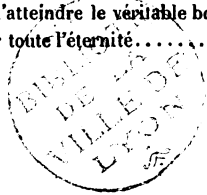
figure de l'homme pécheur, qui ne peut trouver qu'à l'ombre de la croix la confiance, qui est la première condition de la restauration du cœur . Cette restauration commencée par la confiance, il faut l'achever par l'amour de Jésus-Christ, par le courage à le confesser et la fidélité à le servir. C'est le moyen d'atteindre le véritable bonheur pendant la vie, à la mort, et pour toute l'éternité..... 564