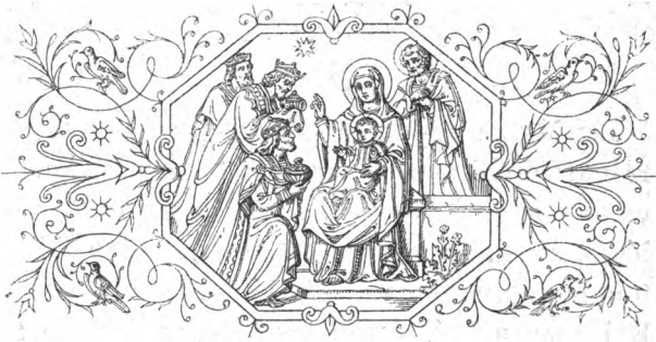
Adoration des Mages.