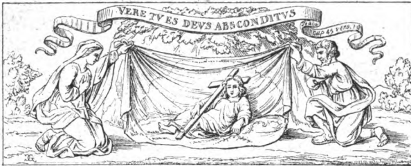
Vous êtes vraiment le Dieu caché. (Isaïe, XLV, 15.) Gravure tirée de l' Histoire Sainte du P. N. Talon. Paris, 1669.