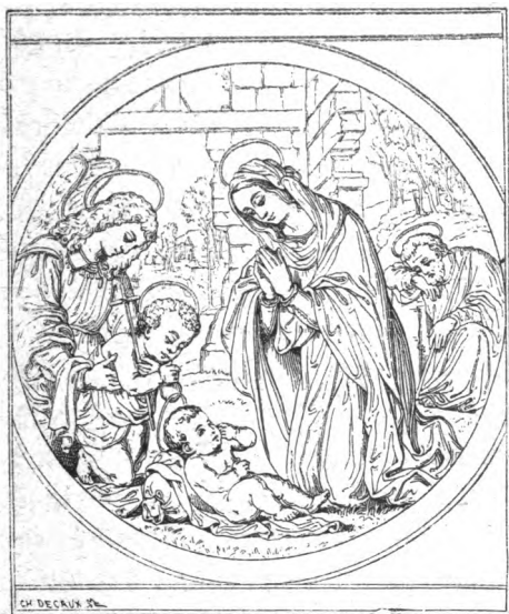
La Sainte Famille.

jamais. C'est là, dans ce temple incomparable, que nous avons eu, à la suite de tant d'autres, le bonheur de vénérer ces corps de rois-martyrs, objet d'un culte ardent comme l'amour,